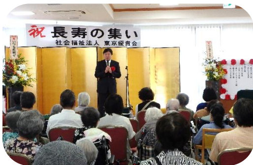
コロナ前の敬老会の様子

今後の対応としては、他の高齢者施設の対応、感染状況の把握して慎重に開放していこうと思います。今年の大きな目標はこの 3 年間制限されていたご家族様とご利用者様、ご家族様と職員との交流をできるだけ感染前の状態に戻していきたいと思っています。その一つとして、感染状況が落ち着いていれば 9 月の敬老会は家族会も同時に開催し、ご家族様との交流の場が設けられたらと思っています。又、納涼祭も時期をずら